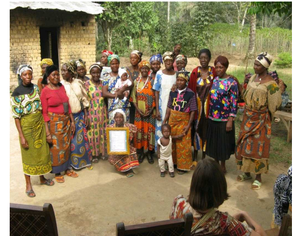
Verwitwete Frauen mit eigenem Landrecht, Projekt wird vom deutschen WGT unterstützt.

Schön, wenn Sie am ersten Freitag im März mitfeiern. Ganz schön, wenn Sie Lust haben, einmal bei der Vorbereitung für den Gottesdienst zum Weltgebetstag mitzumachen. Neue Frauen sind herzlich willkommen! Ihre Kirchengemeinde weiß, wen Sie ansprechen können.