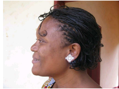
WGT-Anstecker als Ohring