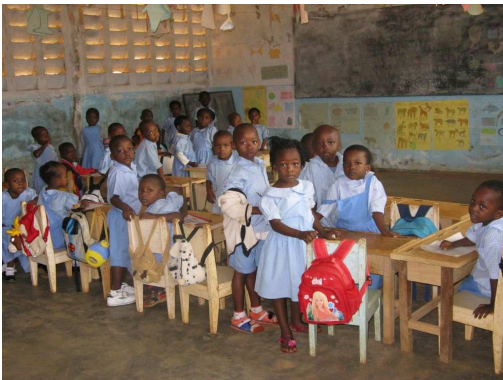
Schulkinder einer Elementarschule in Yaoundé/Kamerun