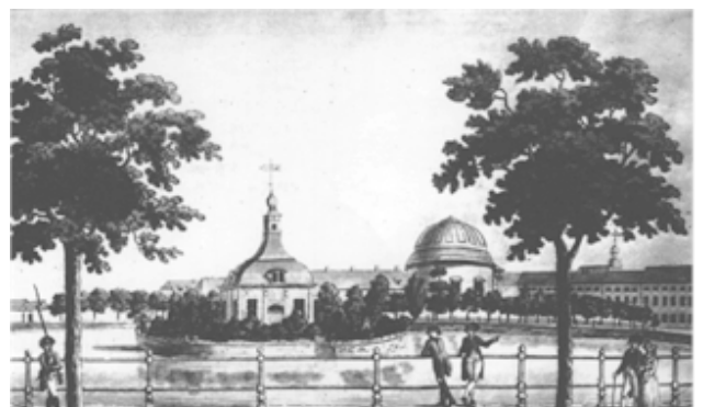
Blik op de Franse kerk over het Bassin , eind 18e eeuw

Een uitwerking van deze wens vind je aan het Bassin-platz (het park achter de kerk). Hier kon in 1867 dicht bij de Hugenotenkerk een Rooms-Katholieke kerk worden gebouwd. Daardoor werd het mogelijk gemaakt met elkaar om te gaan zonder aan het verleden voorbij te gaan en werd de weg geëffend naar een toekomst zonder spanningen.